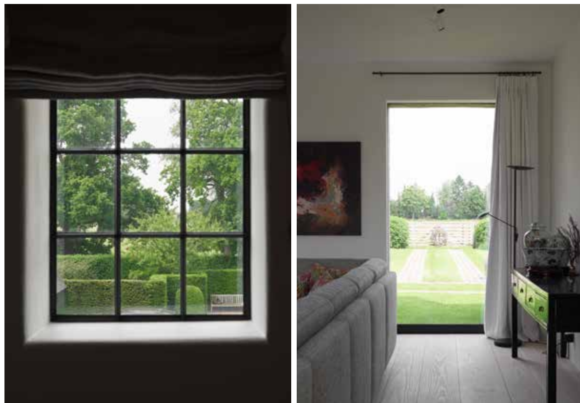
De oorspronkelijke buitendeuren en poorten werden vervangen door glaspartijen om zo licht en ruimte te creëren.