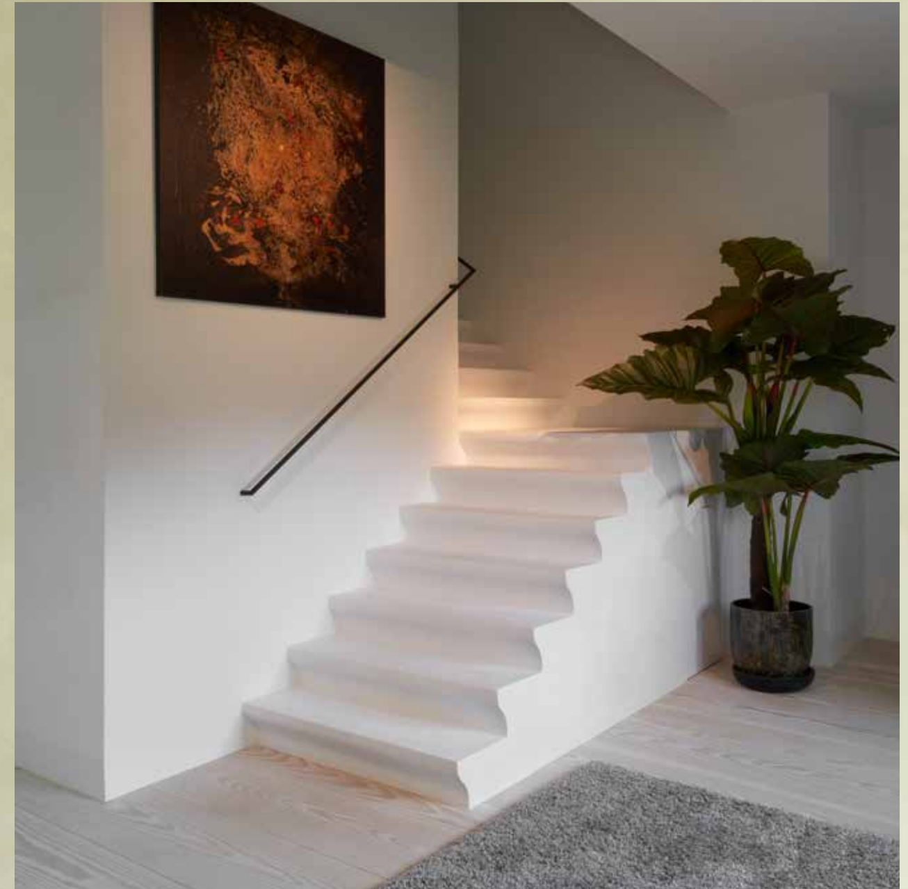
De traphal is een echte eyecatcher in huis. Hij is heel sober vormgegeven en afgewerkt in oud pleisterwerk en Microtopping.